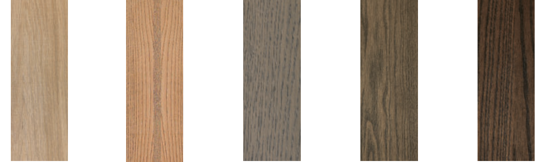
Rovere Naturale Natural Oak

Please see the current price list for the full range of colours available.