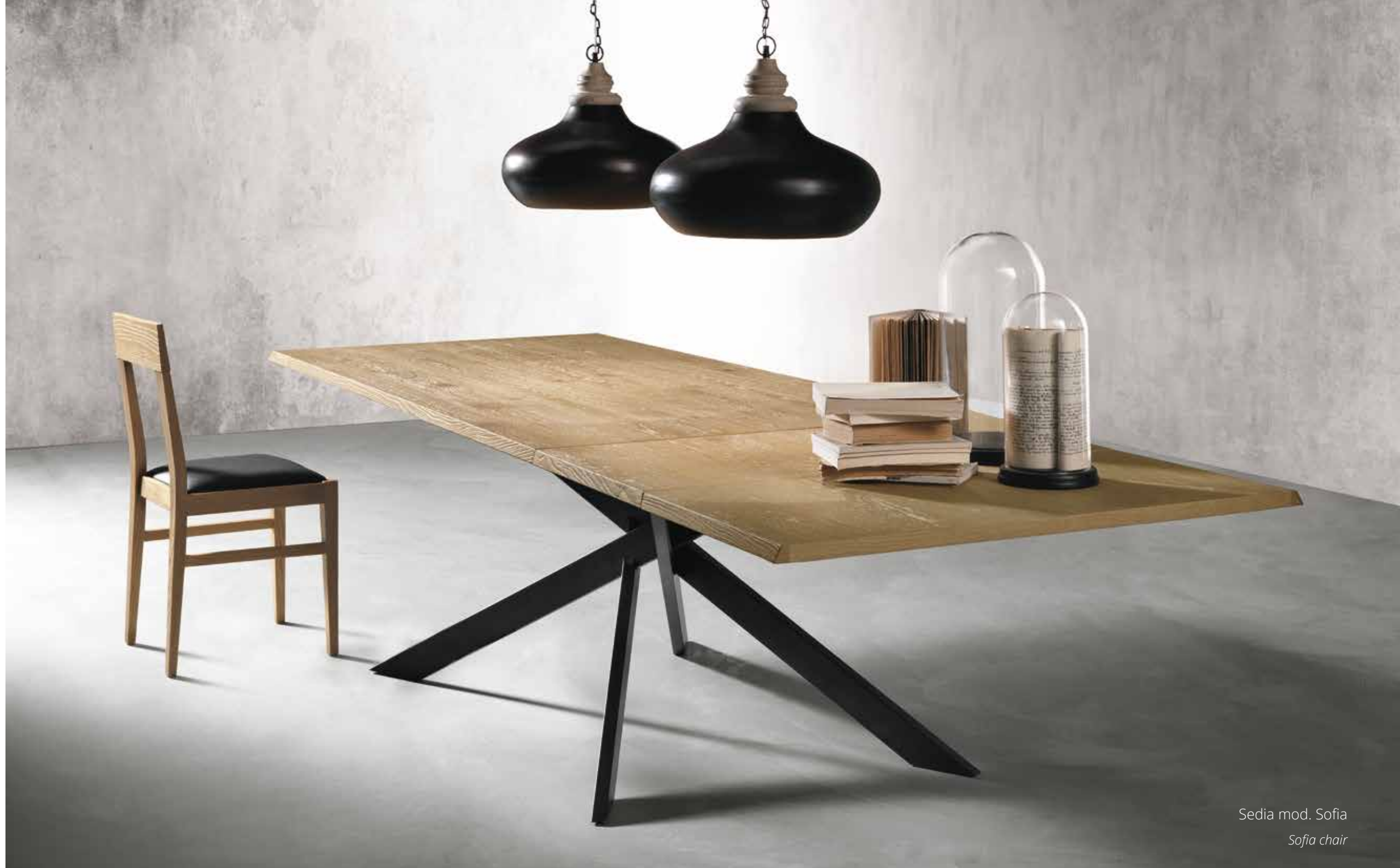
Sedia mod. Sofia Sofia chair

Available sizes: 170x90 /270 cm - 200x100 /300 cm. Places: 6/10 (size 170) - 8/12 (size 200). Height from the floor: 75 cm.