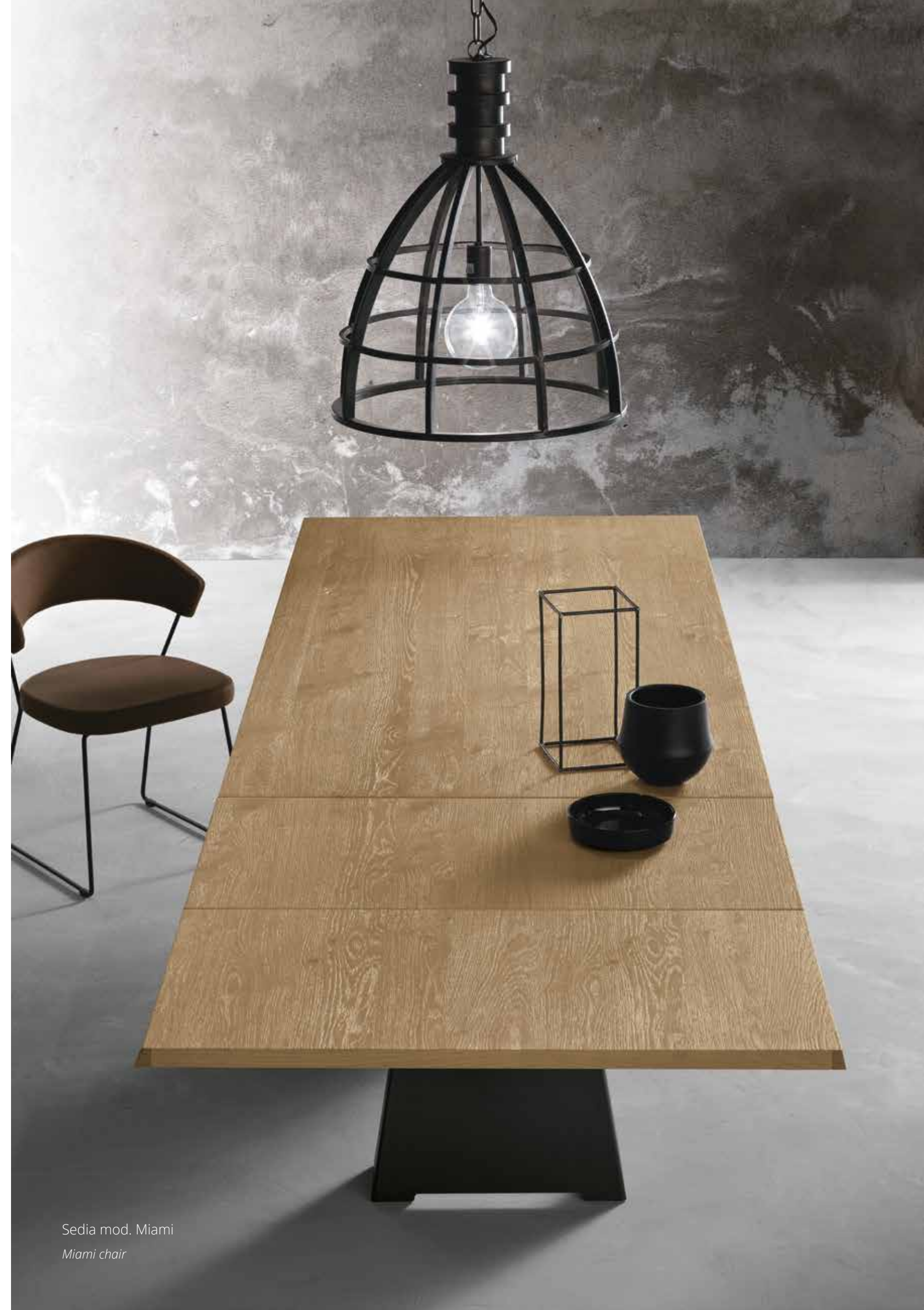
Sedia mod. Miami